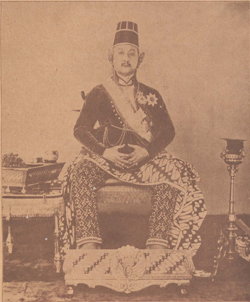
Swara-Tama. Sampéjan Dalem Ingkang Sinoehoen Kangdjeng Soeltan Hamangkoe Boewana ingkang kaping VIII

DJANMA AWISIKAN, DWIPANGGA AWANI; AWANI NGOJAG - OJAG PANAGAN ING BOEMI. (1851 - 1861)